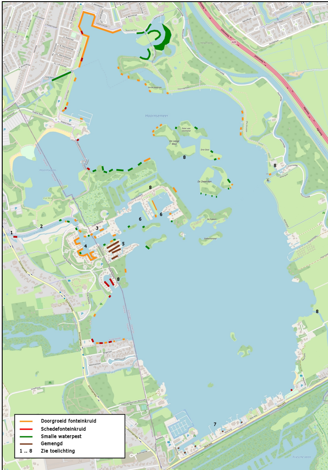
Afbeelding 1. Gecombineerde vegetatiekaart van aangetroffen begroeiing bij inspectieronde (5 juni 2023) en karteringsronde (15 augustus 2023)

Doorgetrokken lijnen betekent dat de een min of meer aaneengesloten begroeiing langs de oever voorkwam. De begroeiing was vrijwel nergens breder dan 10 m vanaf